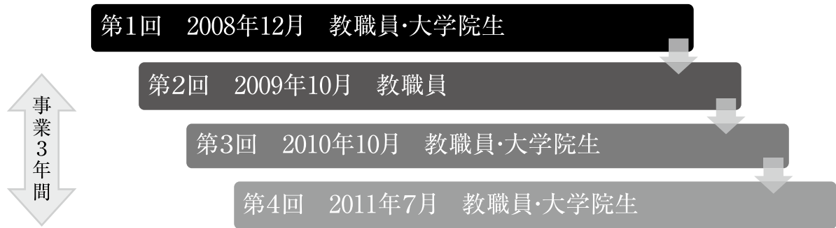
図1 調査対象者と調査時期

具体的に山形大学の全ての教職員とは、全ての常勤教職員と定時・短時間勤務職員を含む。医学部では医員及び研修医、また、他学部では附属支援施設等の教職員を含んでいる。その結果、毎年度人数は異なるが、おおよそ2,500人が調査対象となった。